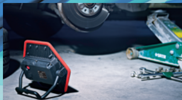
暗い場所の作業に