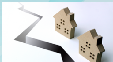
防災時の非常灯に