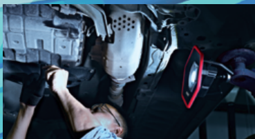
車・機械の修理や点検に