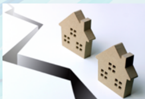
防災時の非常灯に