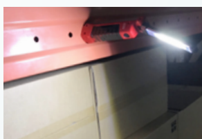
暗い場所での作業に