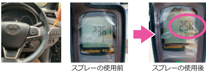
スプレーの使用前